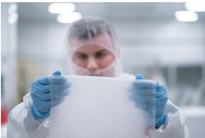
Abb. 1 Die Vliesstoffe für die FFP-2-Masken müssen nach DIN mindestens 94 Prozent der Aerosole, Partikel oder Viren filtern.

Die Fraunhofer-Forschenden beschränken sich bei der Anwendung der Methode keineswegs nur auf Masken und Luftfilter. Ihre Technologie lässt sich ganz allgemein in der Produktion von Vliesstoffen einsetzen, beispielsweise auch bei Stoffen für die Filtration von Flüssigkeiten. Auch die Herstellung von schalldämmenden Vliesstoffen lässt sich mit ProQuIV-Methoden optimieren.